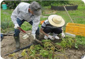
じゃがいもの収穫の様子