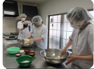
厨房での取材の様子

メンバーは、「これからも丁寧な作業を心がけ、安心安全な商品作りをしたい」と話していました。