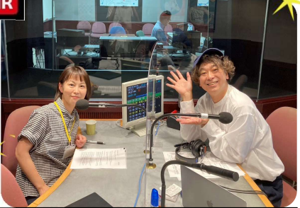
FM とやまのスタジオの様子