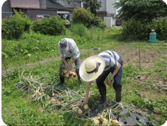
玉ねぎの収穫の様子

収穫した玉ねぎやじゃがいもは、給食の食材や販売品となり、じゃがいもは、「ホクホクで美味しかった」と好評でした。