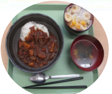
ひんやり爽やかフルーツポンチがついて豪華なランチ！