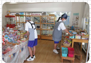
陳列棚の整理の様子