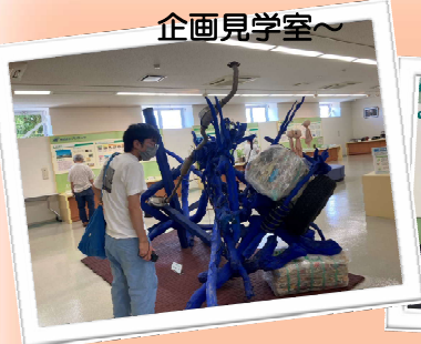
～エコタウンの企画見学室～

まず、センターでエコタウンについての話を聞いた後、プラスチックや木質廃棄物施設など見学し、地球にやさしい暮らしについて学びました。दैい工房でも、ほかし肥作りなどエコについて取り組んでいるため、改めて環境について考える機会にもなりました。