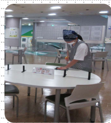
交流スペースでの様子

カミール全体の運営や各テナントの仕事についても体験され、短い時間でしたが、ámieで交流スペースや店内の整理などを行いました。