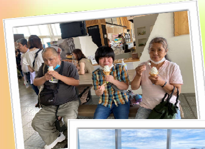
～ウェーブパークなめりかわ～